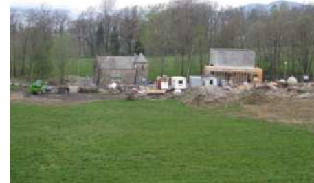
Ny kraftstasjon og nytt anlegg i 2008